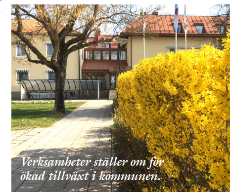
Verksamheter ställer om för ökad tillväxt i kommunen.