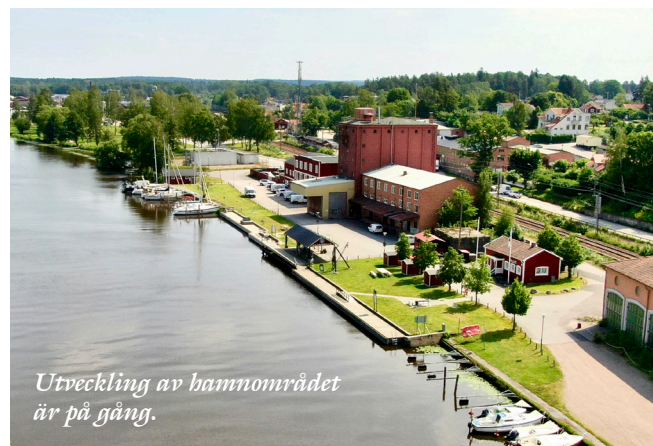
Utveckling av hamnområdet är på gång.

- Kommunen utvecklas idag med stor fart och vi är ändå bara i början. Vi förbereder och anpassar oss för en större expansion. Vi ser fram emot det och ska leverera det absolut bästa vi kan, säger Rune Larsen.